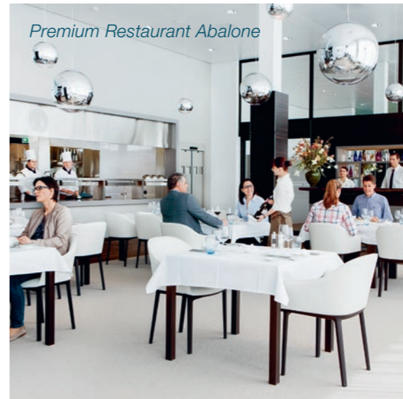
Premium Restaurant Abalone

Die Sporthalle stellt eine wertvolle Ergänzung zum Therapie-, Sport- und Freizeitangebot dar. Zudem stehen für differenzierte Rehabilitationstherapien u. a. zwei Kletteranlagen (indoor/outdoor) zur Verfügung. Solche spielerisch-sportlichen Trainingsmöglichkeiten, die den Patientinnen und Patienten Spass bereiten, sind heute als wirkungsvolle Therapiekomponenten anerkannt.